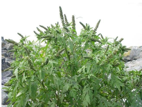
Ambrosia artemisiifolia .

При избрания вариант на провеждане на политика чрез предложения регламент се очаква, че: 1) годишните разходи за действие ще останат стабилни или дори ще намаляват във времето; 2) мащабът на ползите (например избягването на разходи за щети и управление) ще продължи да нараства през годините поради предотвратяването на все повече инвазии; 3) общите разходи по проблема няма да се увеличат дотолкова, че да се наложи действие от страна на ЕС.